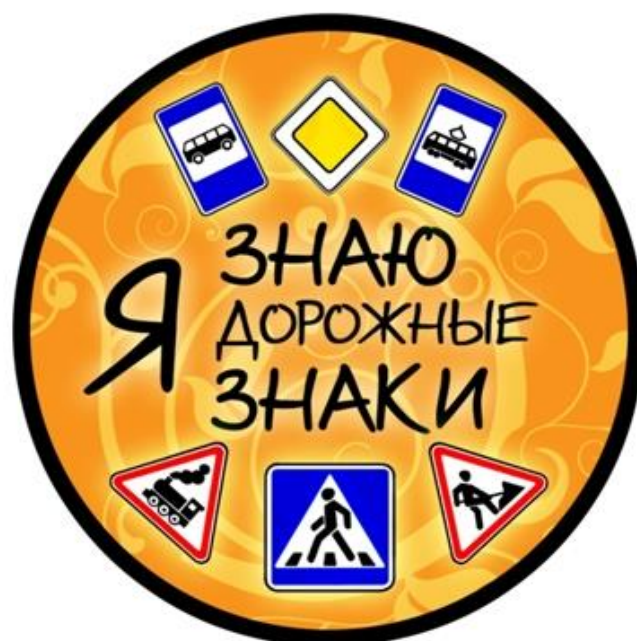
Жетон для команды «Дорожные знаки»