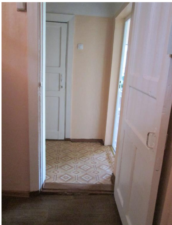
Фото № 7 Тамбур эваку. группы №2