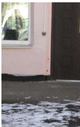
Фото № 5 Тамбур