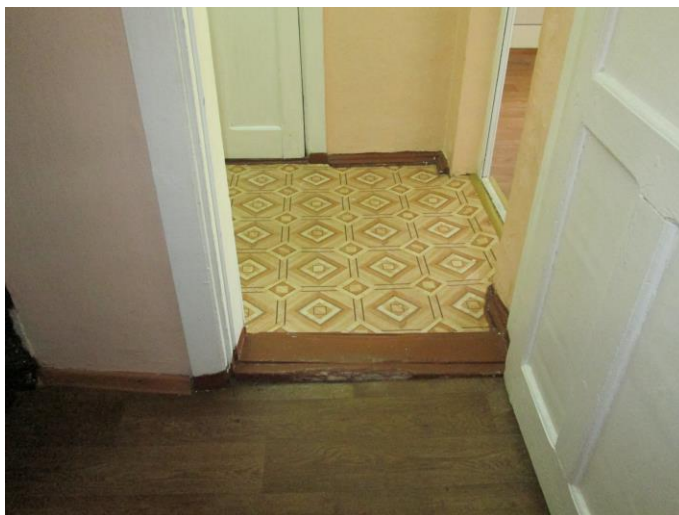
Фото № 10 Вход в музыкальный зал