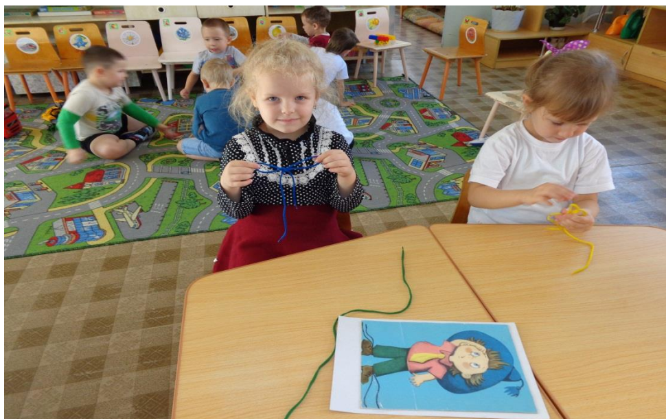
/Научим Незнайку завязывать шнурки/.