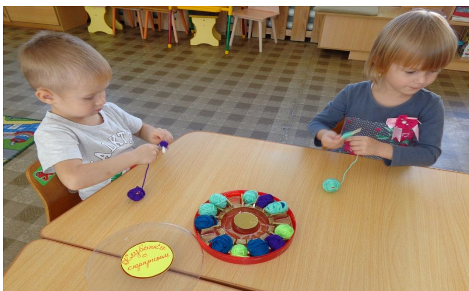
/Интересно, что же там внутри?/