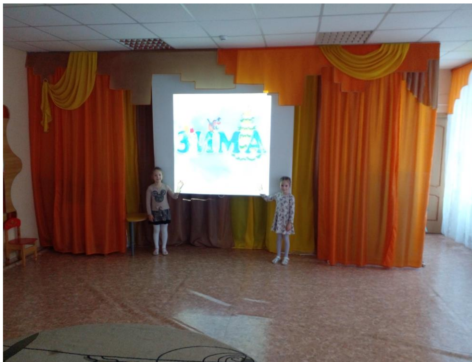
Рассматривание иллюстраций «Зима и Новогодний праздник»