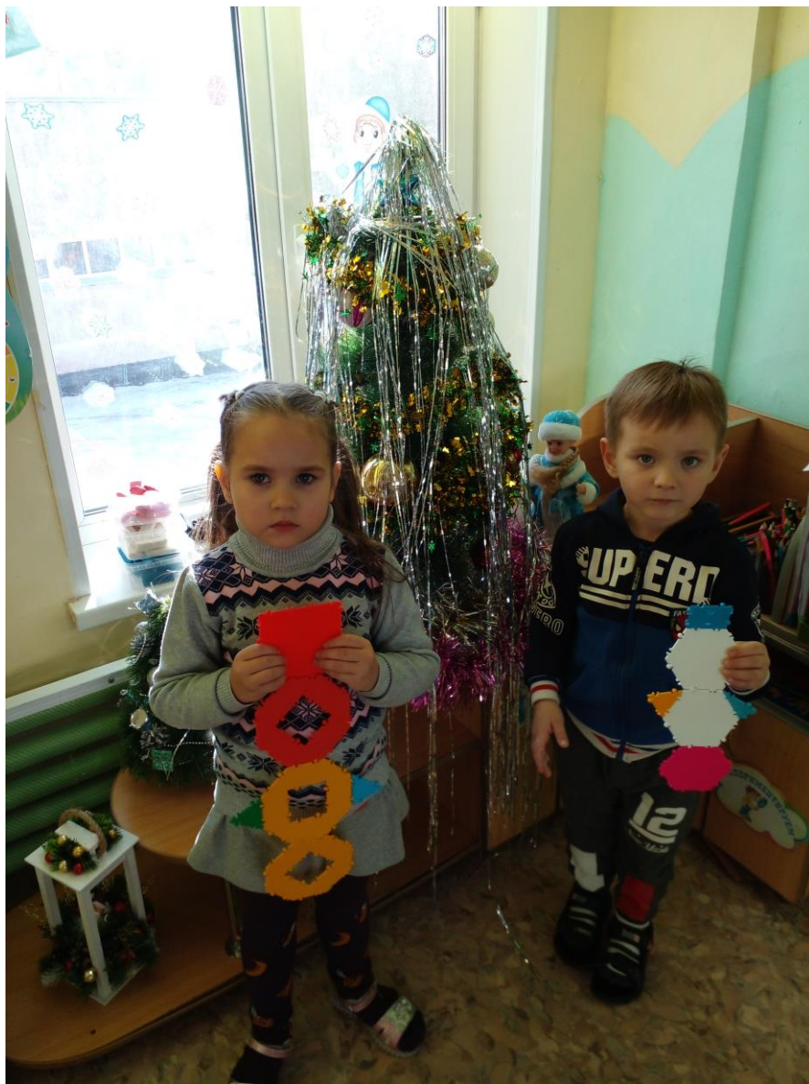
Аппликация «Дедушка Мороз»